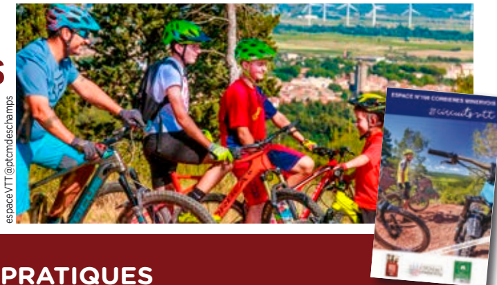
es pace VTT @ptcmdescamps

Possibilité de charger gratuitement vos traces GPX et vos randonnées.