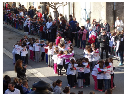
Pour commémorer les 70 ans de l'USEP un flash mob symbolisant les différents sports a été exécuté par les enfants