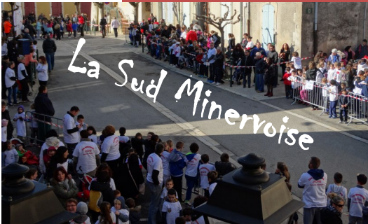
813 élèves se sont retrouvés sur la place du village.

Autre projet mais celui-ci départemental, une exposition d'art plastique sur les couleurs. L'exposition aura lieu au mois de mai à la salle Gibert à Lézignan.