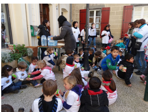
Mais après l'effort... le réconfort