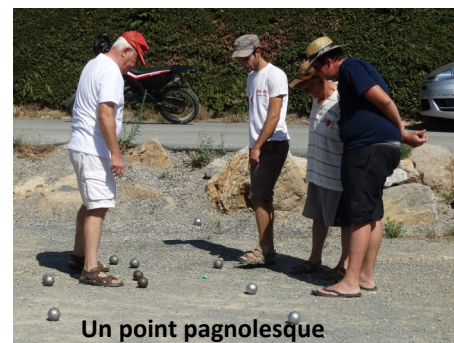
Un point pagnolesque