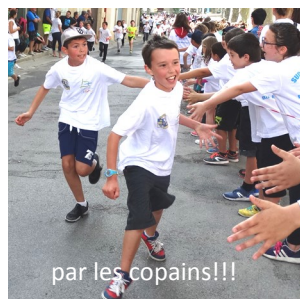
par les copains!!!