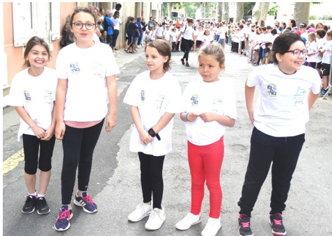
Une équipe féminine au départ pour 12 mn