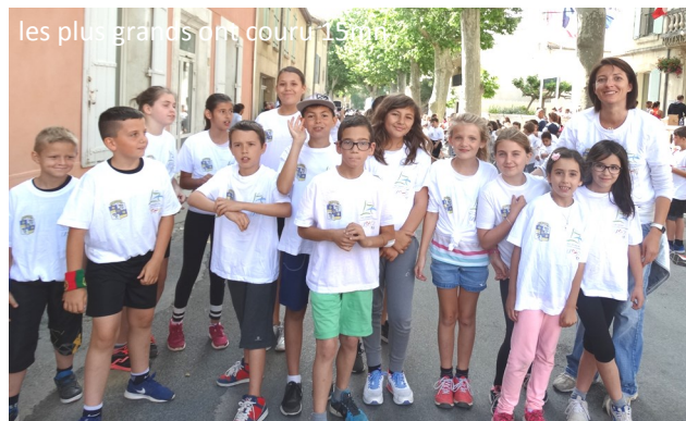
les plus grands ont couru 15 mn