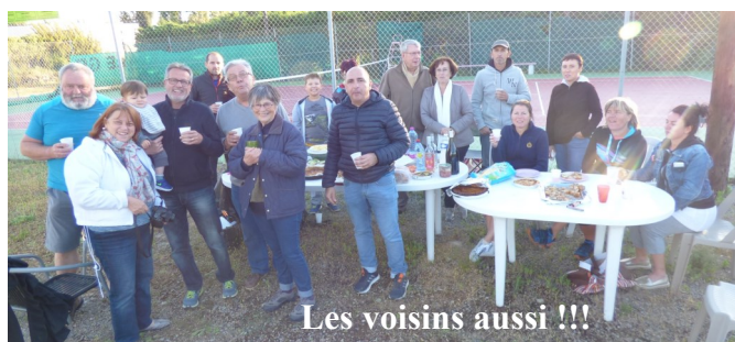
Les voisins aussi !!!