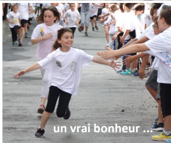
un vrai bonheur ...