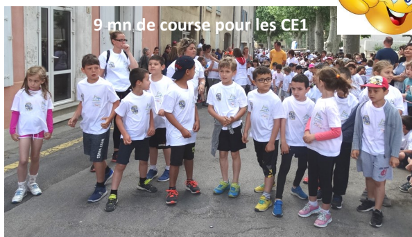
9 mn de course pour les CE1