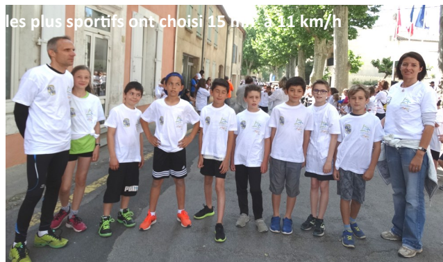
les plus sportifs ont choisi 15 mn à 11 km/h