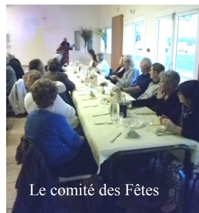
Le comité des Fêtes