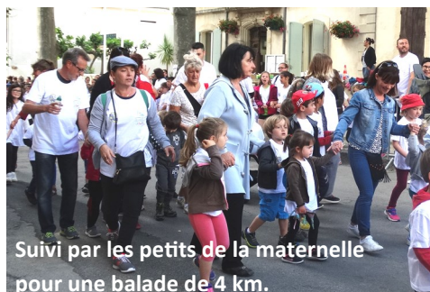
Suivi par les petits de la maternelle pour une balade de 4 km.