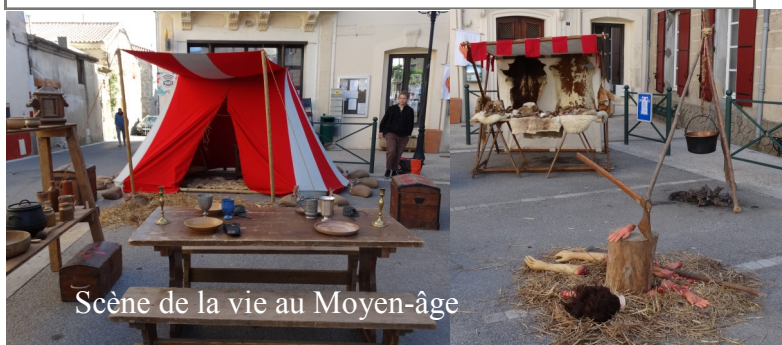
Scène de la vie au Moyen-âge

Mais pendant la marche, sur la place, des bénévoles ont préparé la Fête Médiévale