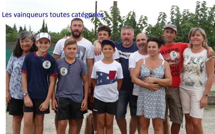
Les vainqueurs toutes catégories

Samedi 26 août, le concours de pétanque a rassemblé beaucoup de familles (couples, parents enfants, cousins, frères...).