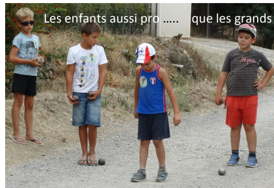
Les enfants aussi pro ..... que les grands