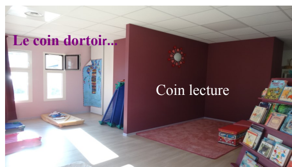
Le coin dortoir...