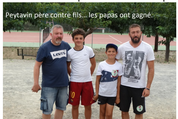
Peytavin père contre fils... les papas ont gagné.

15 doublettes de passionnés de ce jeu provençal se sont affrontées lors de parties souvent très disputées.