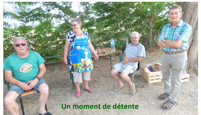
Un moment de détente